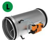
VAV-SPJÆLD RVP C-MOD B