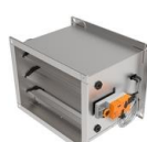
VAV-SPJÆLD RVP P-MOD B