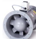
SYREFAST AKSIAL VENTILATORER