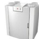
AGGREGAT FLAIR 225