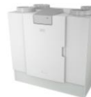
AGGREGAT FLAIR 450/600